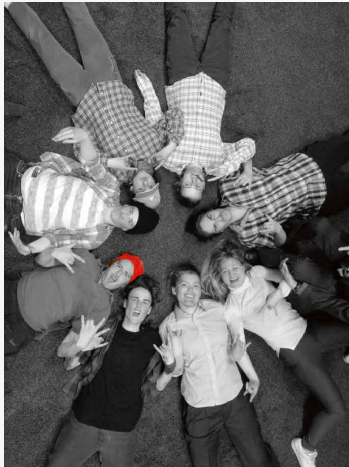
KROPP I CENTRUM: På Borgerscenen ved Aarhus Teater er borgernes levede liv, tanker, følelser og kroppe i centrum. Borgerne medvirker som hverdagskasperter i deres eget liv, og bliver aktører i forestillinger, teaterklubber og teatermiddage. Billedet er fra en klubfestival, hvor arbejdet fra klubberne blev præsenteret.