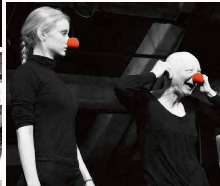
BORGERE I TEATERMASKINERIET: Scener fra gennemspilning på Borgerscenens sidste musikalske forestilling Fædre , fra Borgernes arbejde i teaterklubberne som præsenteres i Borgerscenens klubfestival , og Teatermiddagen Mennesket med, mod og på kloden om bæredygtighed og forbrugerisme .